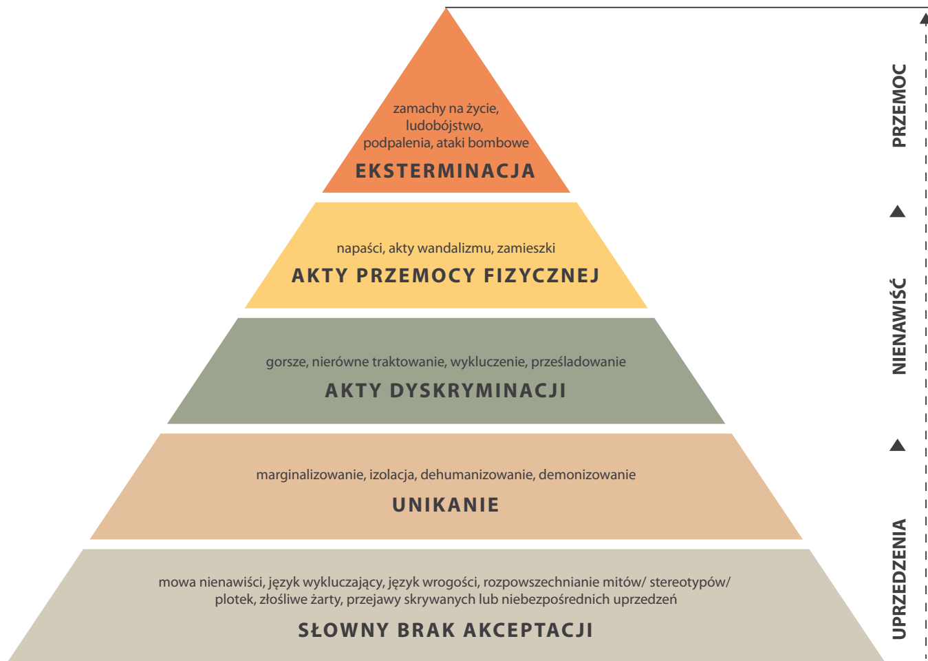
Piramida nienawiści Gordona Allporta (1954)